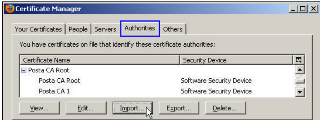
Slika 2. Instalisani CA sertifikati Sertifikacionog tela Pošte u Mozilla Firefox

Instalisanje CA sertifikata započinje pritiskom na dugme Import... (slika 2.) i izborom datoteke sertifikata PostaCARoot.cer i PostaCA1.cer , koje se nalaze na instalacionom CD-u (X:\CA sertifikati) i na Web strani http://www.ca.posta.rs/ca-sertifikati . Prilikom instalisanja CA sertifikata moraju da budu čekirane sve tri (3) opcije namene sertifikata, kao što je prikazano na slici 3. i 4. Ispravno instalisani CA sertifikati Sertifikacionog tela Pošte su prikazani na slici 2.