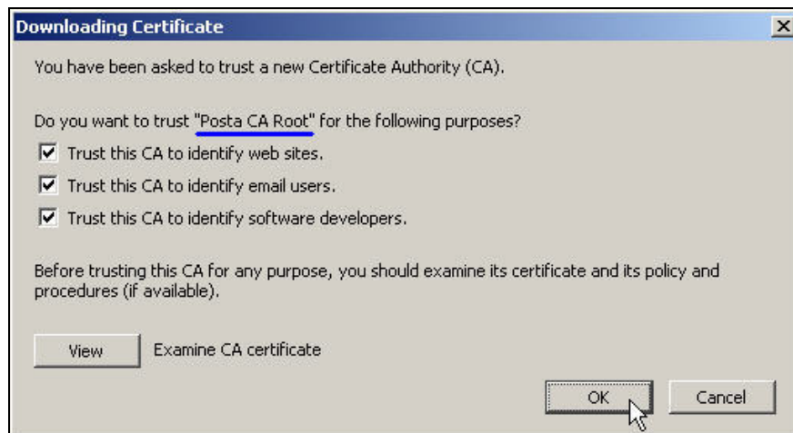
Slika 3. Čekirane su sve sve tri (3) opcije namene sertifikata "Posta CA Root"