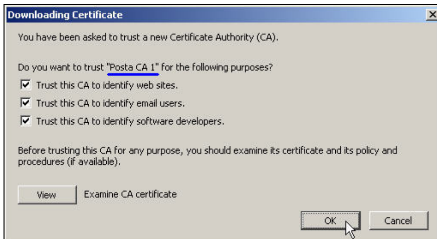
Slika 4. Čekirane su sve sve tri (3) opcije namene sertifikata "Posta CA 1"