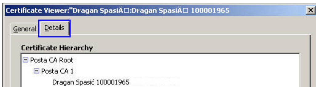
Slika 7. Kompletna sertifikaciona putanja od tri (3) sertifikata