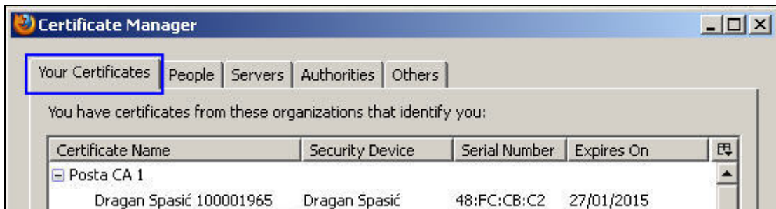
Slika 6. Sertifikat korisnika

Ako je uspešno izvršeno navedeno instalisanje i konfigurisanje, posle stavljanja smart kartice u čitač smart kartica ili USB tokena u USB port računara, sertifikat korisnika treba da postoji na formi Certificate Manager i kartici Your Certificates , kao što je prikazano na slici 6. Neophodno je da postoji puna sertifikaciona putanja od tri (3) sertifikata, kao što je prikazano na slici 7.